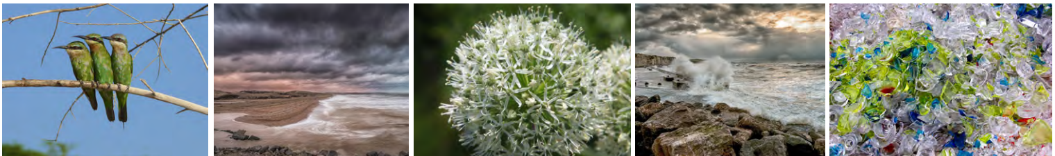
Els Hoet-Derycke – LC Oostende B04

Een tevreden voorzitter van de LC Environmental Photo Contest